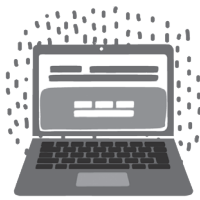
온라인 응답 my2020census.gov

캘리포니아 주민들은 세 가지 방법 중 하나를 이용해 인구조사에 참여하실 수 있습니다: