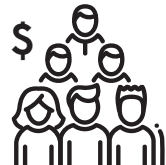
경제 발전 및 일자리 창출

캘리포니아 주민들은 세 가지 방법 중 하나를 이용해 인구조사에 참여하실 수 있습니다: