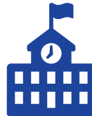
주거 및 교육 프로그램