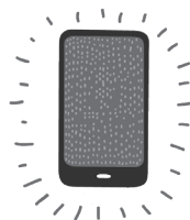
전화 응답 844-330-2020