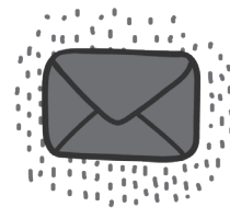
우편 응답 여러분의 인구조사 양식을 작성 하여 회신하십시오!

모든 커뮤니티들은 마땅히 그들의 가족을 부양하고 번성할 기회를 가져야 합니다.