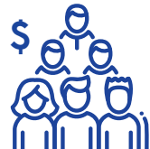
경제 발전 및 일자리 창출

캘리포니아 주민들은 세 가지 방법 중 하나를 이용해 인구조사에 참여하실 수 있습니다: