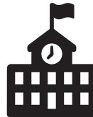
주거 및 교육 프로그램