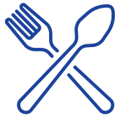
아동 영양 프로그램