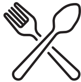
아동 영양 프로그램