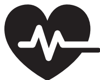
医疗设施与紧急服务