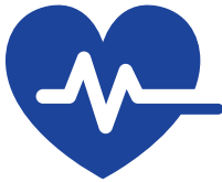
医疗设施与紧急服务