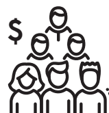
经济发展与创造就业岗位